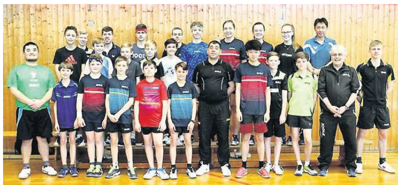
Inzwischen bereits im 24. Jahr veranstaltete der TTV Weinheim-West sein Oster-Trainingslager für den eigenen Nachwuchs.

Ein großer Dank geht an die Eltern, welche mittags für die Teilnehmer kochten. Abends sorgten gemeinsame Spiele und ein Filmabend für die nötige Abwechslung. Das Trainingslager hat bei den jungen Spielern wieder für einen spürbaren Motivationskick gesorgt. Bei den bevorstehenden Ranglisten und entsprechenden Turnieren können sie das Gelernte gleich unter Beweis stellen. mak