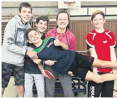
Gruppenbild mit Dame: Hemsbach gewann das Tischtennis-Kreisfinale.