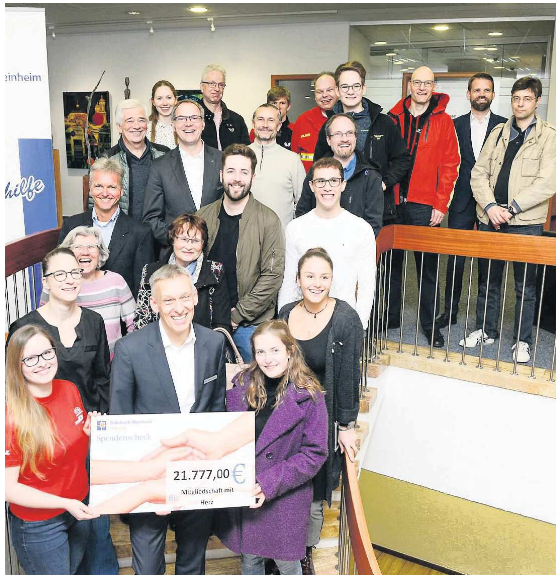
Die Volksbank Weinheim Stiftung sorgte gestern, in Verbindung mit ihrer Förderplattform „Mitgliedschaft mit Herz“, für strahlende Gesichter bei der Verteilung von Spenden an zehn Vereine und Institutionen.

Sicherheit wird bei Organisationen wie der DLRG groß geschrieben. Die Lebensretter in Hemsbach und in Heddesheim freuten sich gestern über Zuwendungen in Höhe von 1700 und 2410 Euro. Unter anderem werden sie von dem Geld