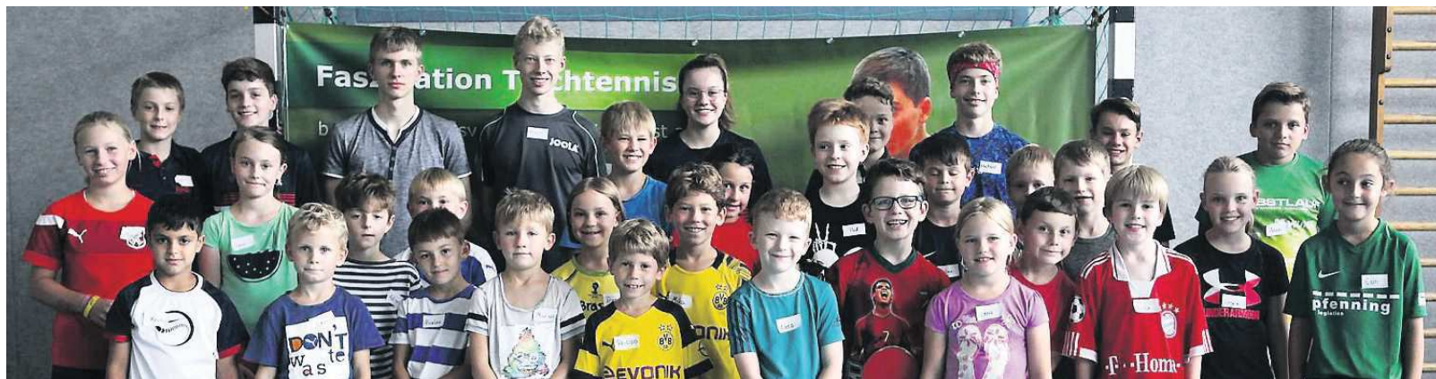
Der Schnuppernachmittag des Tischtennisvereins Weinheim-West erfreute sich im Rahmen der Ferienspiele wieder großer Beliebtheit.

gen stand der Spaß im Vordergrund. So wurde jedes Kind mit einem kleinen Preis belohnt. Auch „Robi“ zog die Kinder magisch an. Der Tischtennisroboter spielte automatisch