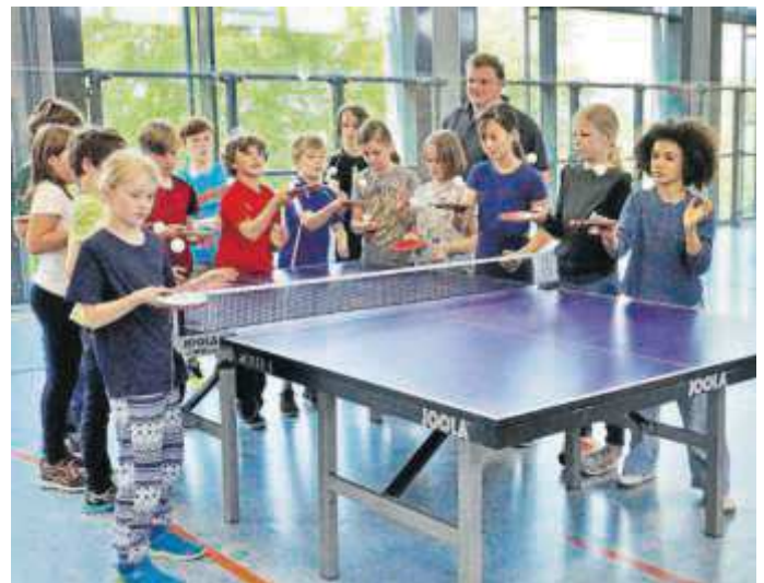
Schülerinnen und Schüler der Sepp-Herberger-Grundschule übten sich beim Umgang mit Tischtennisball und -schläger.

Wer dabei auf den Geschmack gekommen ist: Der TTV West bietet freitags von 18 Uhr bis 19.30 Uhr in der Dietrich-Bonhoeffer-Sporthalle ein Schnuppertraining an.